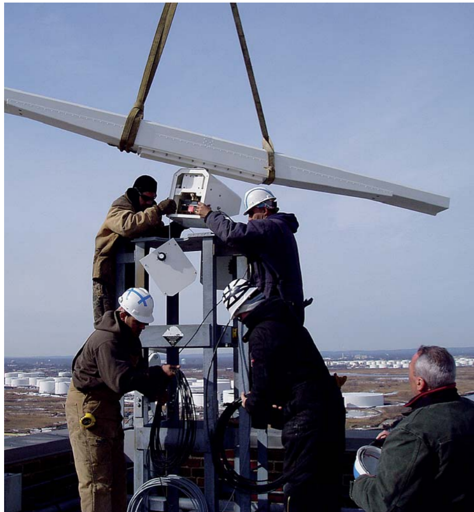
● Termas radarer overvåger de største og vigtigste havnebyer i både Europa og USA. ● Terma's radar systems survey the largest and most important ports in Europe and the U.S.

● Siden etableringen i 1949 har Terma udviklet og forhandlet højteknologiske løsninger til civile og militære applikationer til danske og internationale kunder. Virksomhedens produkter og systemer er beregnet på ekstreme missionskriske miljøer og situationer, hvor menneskeliv og værdifulde materielle aktiver står på spil.