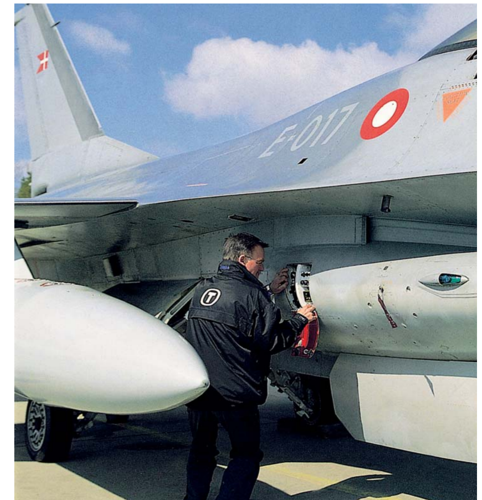
● Terma udvikler og producerer rekognosceringsudstyr samt strukturdele og udstyr til flyproducenter. ● Terma develops and manufactures reconnaissance equipment as well as aerostructures for international aircraft manufacturers.